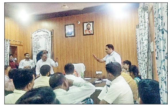
नारनौल। बैठक में हंगामा करते पार्षद।