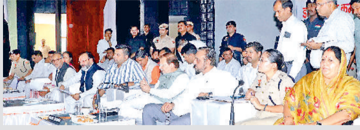
नारनौल। शिकायतकर्ता की बात सुनते मंत्री डॉ. अरविंद शर्मा।

बैठक में सबसे अधिक शिकायतें जनस्वास्थ्य विभाग से थीं। वहीं, नगर परिषद की कार्यशैली पर भी आमजन की ओर से सवाल उठाए गए। लोगों ने कहा कि अधिकारी उनके फोन तक नहीं उठाते। सहकारिता मंत्री ने डीसी से कहा कि इन सभी विभागों के अधिकारियों को लिखित में नोटिस देकर जवाब मांगे जाए। उन्होंने अधिकारियों को चेतावनी देते हुए कहा कि अगर टेलीफोन नहीं उठाओगे, अगली मीटिंग में किसी ने शिकायत की तो एक्शन लिया जाएगा। मंत्री ने कहा कि अगर फोन नहीं उठाओगे तो जनता क्या करेगी। देश में प्रधानमंत्री नरेंद्र मोदी व प्रदेश में नारायण सिंह सैनी के नेतृत्व में यह व्यापक की संरक्षक है। एक-एक नागरिक को संभालने वाले हम हैं। आप फोन नहीं उठाते, तो कैसे बनेगा।