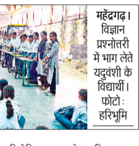
महेन्द्रगढ़। विज्ञान प्रश्नोत्तरी में भाग लेते यदुवंशी के विद्यार्थी।