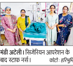
मंडी अटेली। सिजेरियन आपरेशन के बाद स्टाफ नर्स।