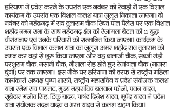
हरियाणा में प्रवेश करने के उपरान्त एक नवंबर को रेवाड़ी में एक विशाल कार्यक्रम के उपरान्त एक विशाल कलश यात्रा जुलूस निकाला जाएगा।