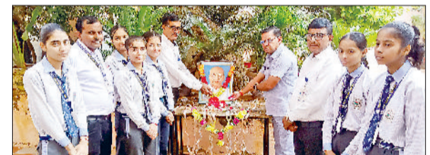
महेंद्रगढ़। सरदार पटेल को श्रद्धांजलि अर्पित करते हुए।