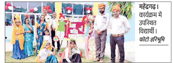
महेंद्रगढ़। कार्यक्रम में उपस्थित विद्यार्थी।